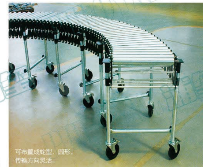
可布置成蛇型、圆形,传输方向灵活。