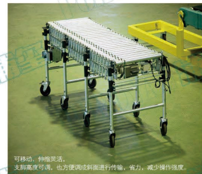
可移动,伸缩灵活,支脚高度可调,也方便调成斜面进行传输,省力,减少操作强度。