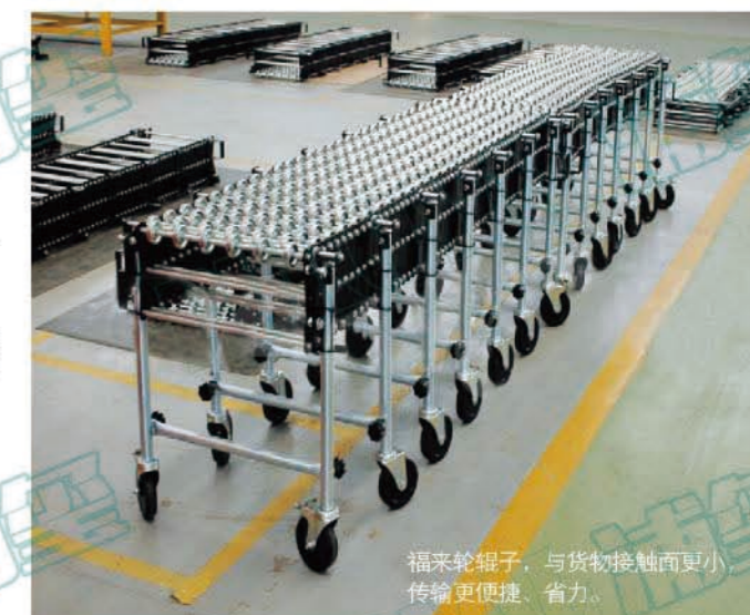
福来轮辊子,与货物接触面更小,传输更便捷、省力。