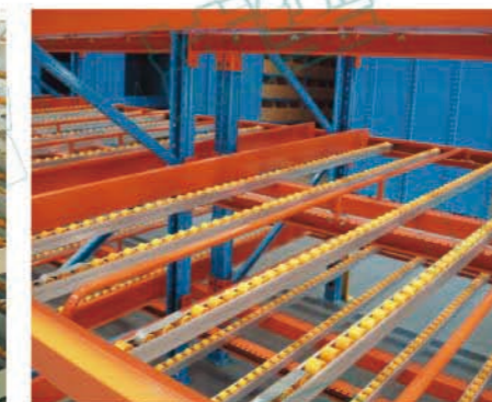
滚轮加装制动片应用