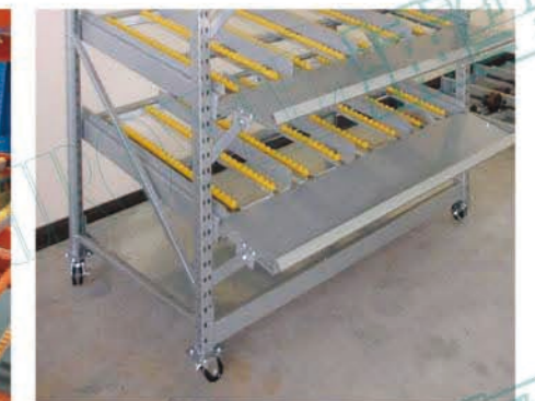
流利架加装脚轮应用，便于移动