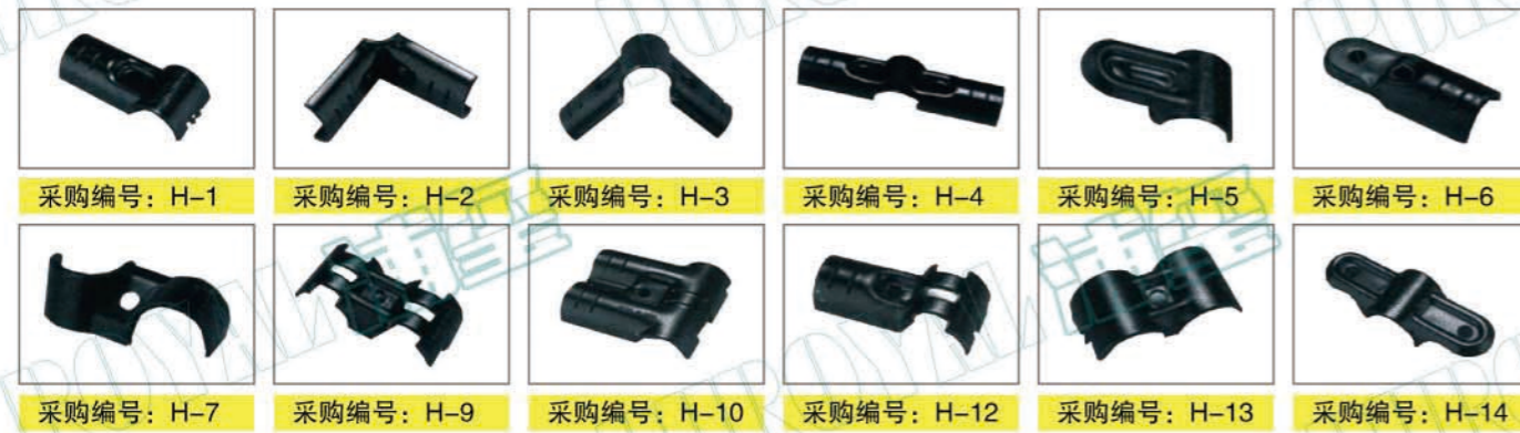
采购编号: H-1 采购编号: H-2 采购编号: H-3 采购编号: H-4 采购编号: H-5 采购编号: H-6