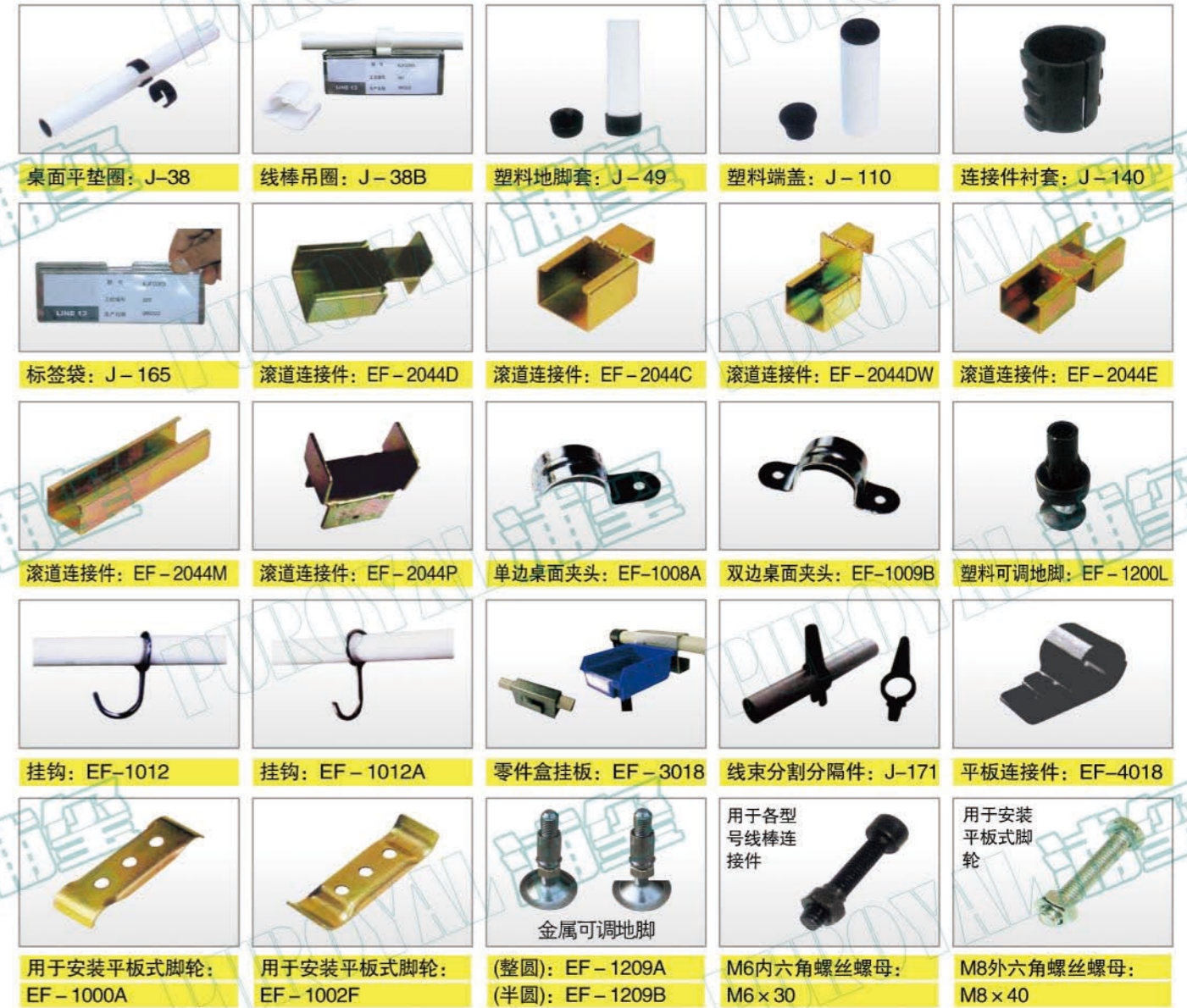
桌面平垫圈: J-38 线棒吊圈: J-38B 塑料地脚套: J-49 塑料端盖: J-110 连接件衬套: J-140 标签袋: J-165 滚道连接件: EF-2044D 滚道连接件: EF-2044C 滚道连接件: EF-2044DW 滚道连接件: EF-2044E 滚道连接件: EF-2044M 滚道连接件: EF-2044P 单边桌面夹头: EF-1008A 双边桌面夹头: EF-1009B 塑料可调地脚: EF-1200L 挂钩: EF-1012 挂钩: EF-1012A 零件盒挂板: EF-3018 线束分割分隔件: J-171 平板连接件: EF-4018 用于安装平板式脚轮: EF-1000A 用于安装平板式脚轮: EF-1002F 金属可调地脚: (整圆): EF-1209A M6内六角螺丝螺母: M6×30 M8外六角螺丝螺母: M8×40 (半圆): EF-1209B